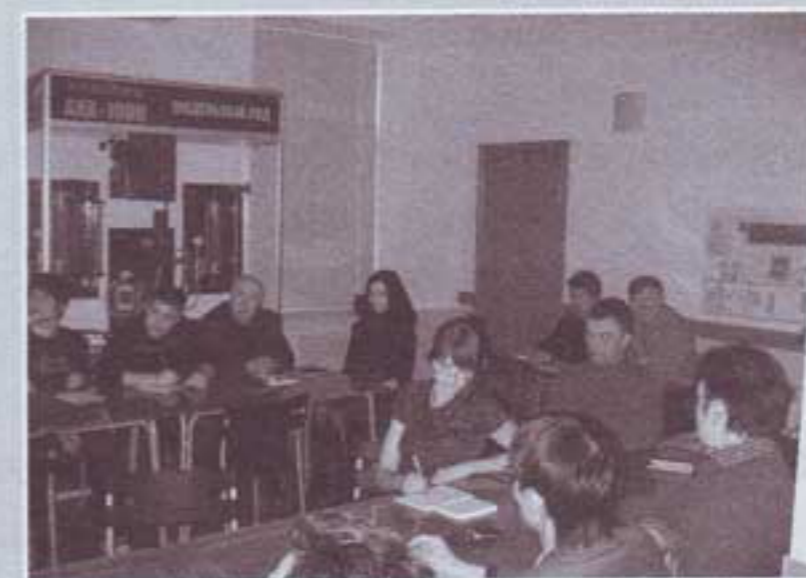
Обучающий семинар ФСП "КРАВТ"