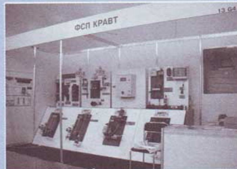
Стенд ФСП "КРАВТ" на выставке "ЭКВАТЭК-2010"